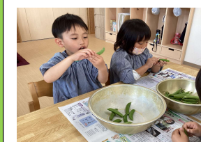
スナップエンドウのすじとり