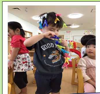
洗濯はさみでおしゃれに変身